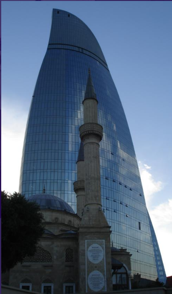
Baku: Flame Tower and The Old Mosque

Aserbaidschan ist ein bipolares Land - es lässt sich sogar darüber streiten, ob es zu Asien oder zu Europa gehört. Kulturell und geologisch hat es viel zu bieten, seien es die Schätze alter Kulturen, die heute UNESCO-Weltkulturerbe sind, seien es brodelnde Schlammvulkane und brennende Berge. Hier wurde nicht nur Alfred Nobel reich. Trotz des Ölbooms blieben Perlen wie die Altstadt Baku erhalten, ebenso wie kleine Ethnien in den Bergen, traditionelle Sichtweisen und eine kräuterreiche Küche.